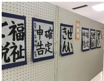
佐賀黒潮総合センター

また、展示が終わりましので、これより作品の返却ならびに表彰状など各校にお届けいたします。大変お忙しい時期になりますが、返却についてよろしく願いいたします。